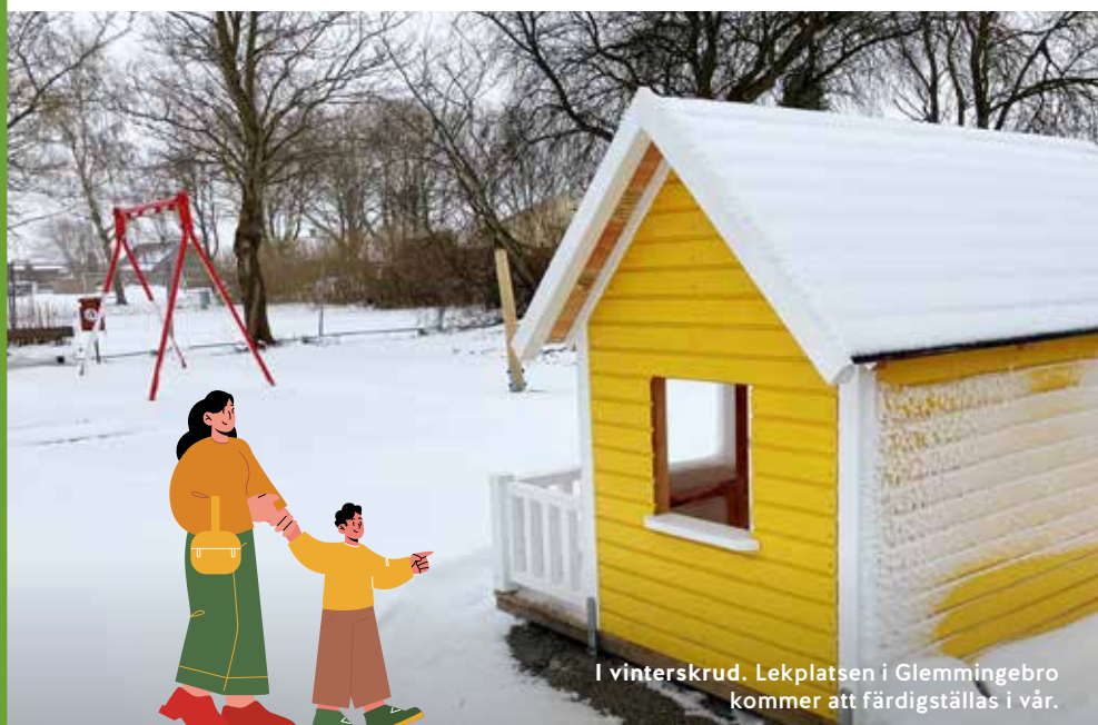
I vinterskrud. Lekplatsen i Glemmingebro kommer att färdigställas i vår.

Byträffar är öppna för allmänheten att delta på. Läs mer om byträffarna på www.ystad.se/landsbygd .